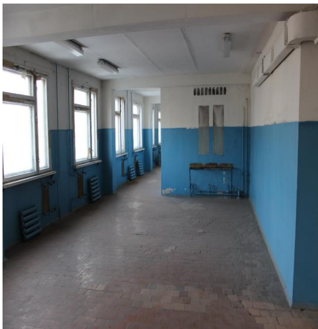
№3 Изолированное помещение инв. №200/D-106524