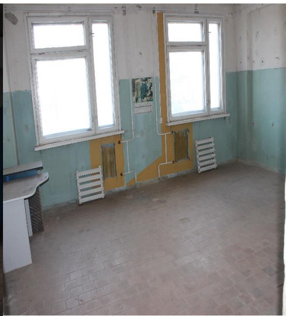
№2 Изолированное помещение инв. №200/D-106524