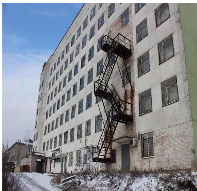
№4 Изолированное помещение инв.№200/D-106524. Вид со двора.