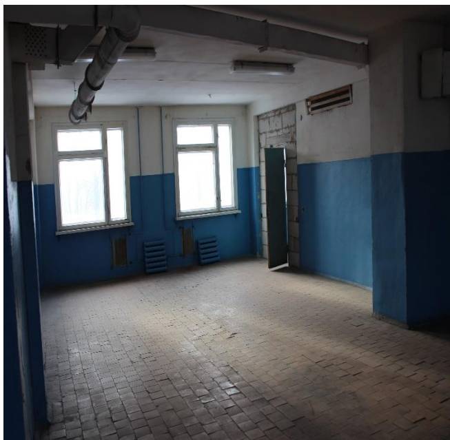
№1 Изолированное помещение инв. №200/D-106524